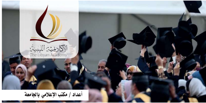
أعداد / مكتب الإعلامي بالجامعة